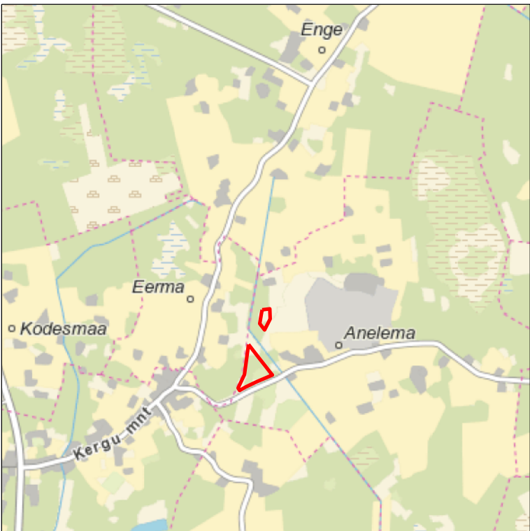
Kaardileht nr 5334 Pärnu-Jaagupi ja 6312 Järvakandi